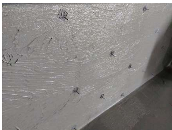
施工写真：常温アスファルト防水

従来の「丸型トンボ」の代替品として、金型から一体成型した高剛性のラス網用金具です。 錆びにくい亜鉛メッキ仕上げ、お求め易い価格のまま強度を向上させました! ※設置目安は 15 ～ 20 cm間隔で千鳥設置。