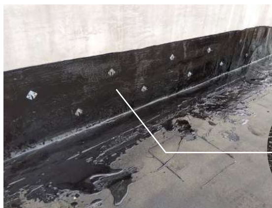
施工写真：熱アスファルト防水