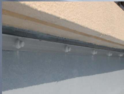
屋上防水アゴ下押え