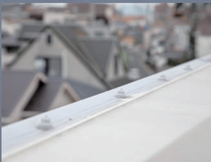
屋上防水 端部押さえ